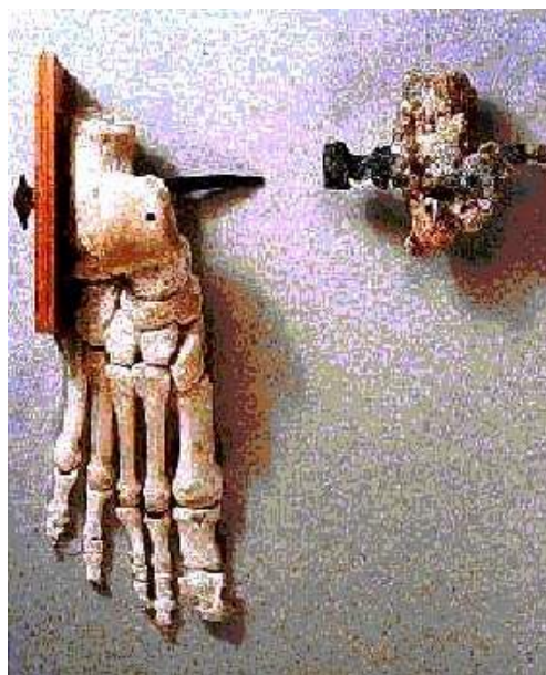
Останки гробницы Гив'ат ха-Мивтар

Часто задаются вопросом, был ли пригвожден Иисус или только привязан к кресту, были ли пригвождены только руки или также и ноги Христа? Слова апостола Павла, что он носит “язвы (στίγματα) Господа Иисуса на теле” (Гал.6:17), убедительно говорят за то, что, во всяком случае, руки Иисуса были пригвождены. Это же подтверждают Евангелия от Иоанна и от Петра 55 (Ин.20:25-27; Евангелие от Петра.21). Кроме того, согласно Луке, Воскресший, для доказательства того, что Он действительно Иисус, а не бесплотный дух (πνεῦμα), предлагает ученикам осмотреть и осязать свои руки и ноги (Лк.24:39; ср. Origenus. Contra Celsum. II.55 ); в этом случае невольно начинаешь думать, что раны от гвоздей имелись у Иисуса не только на руках, но и на ногах. Юстин и Тертуллиан ( Justinus. Dialogus cum Tryphono Iudaeo. 97; Tertullianus. Apologeticus. 21 ) также утверждают, что ноги Христа были пригвождены: “Иисус Христос был распростерт руками и распят иудеями [...]. А слова “пронзили руки Мои и ноги”, были указанием на гвозди, которые на кресте были вбиты в руки и ноги Его” ( Justinus. Apologia I.35 ).